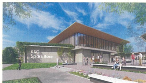
▲KSC Spark Base